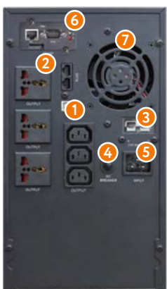
3 кВА (S)